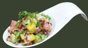
青花藜麥優格沙拉