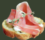
生火腿與 瑞可達起司脆麵包

Soyons reconnaissants envers les gens qui nous rendent heureux, ce sont les charmants jardiniers qui font fleurir nos âmes.