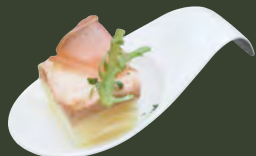
明太子馬鈴薯千層