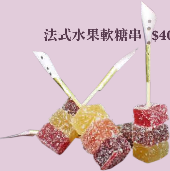
法式水果軟糖串 $40/串