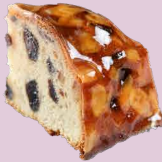
南法茴香水果蛋糕 $80/pc