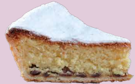
西西里杏仁榛果蛋糕 $100/pc