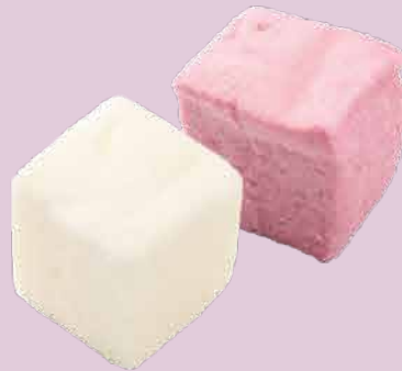
綜合法式棉花糖串 $30/串